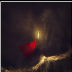
Amy Krencius STATI UNITI